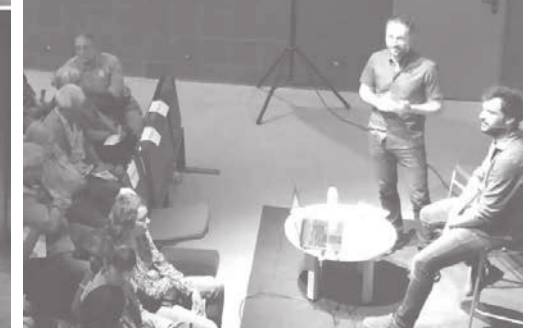
Més de 1500 persones van omplir les quatre xerrades sobre el Porta a Porta al teatre La Lliga.