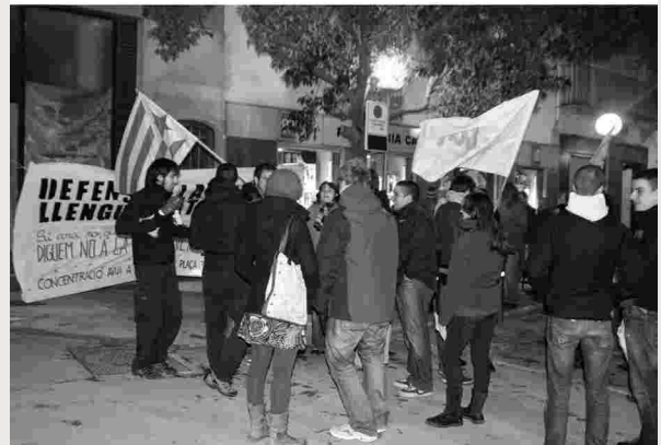
Vila de Capellades també va convocar a la mobilització per a rebutjar la sentència del Tribunal Suprem Espanyol. Com a Capellades, multitud de gent de pobles i ciutats estan sortint al carrer per a mostrar el seu rebuig.